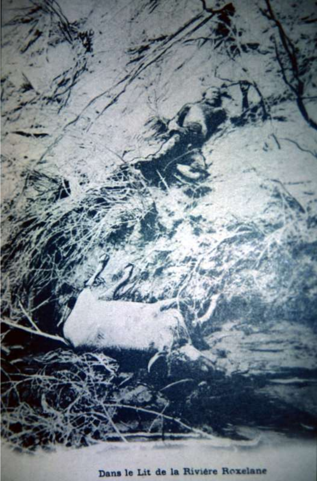
Dans le Lit de la Rivière Roxelane

Beaucoup de morts étaient figés dans des positions naturelles – par exemple une mère allaitant son enfant – indiquant un décès instantané