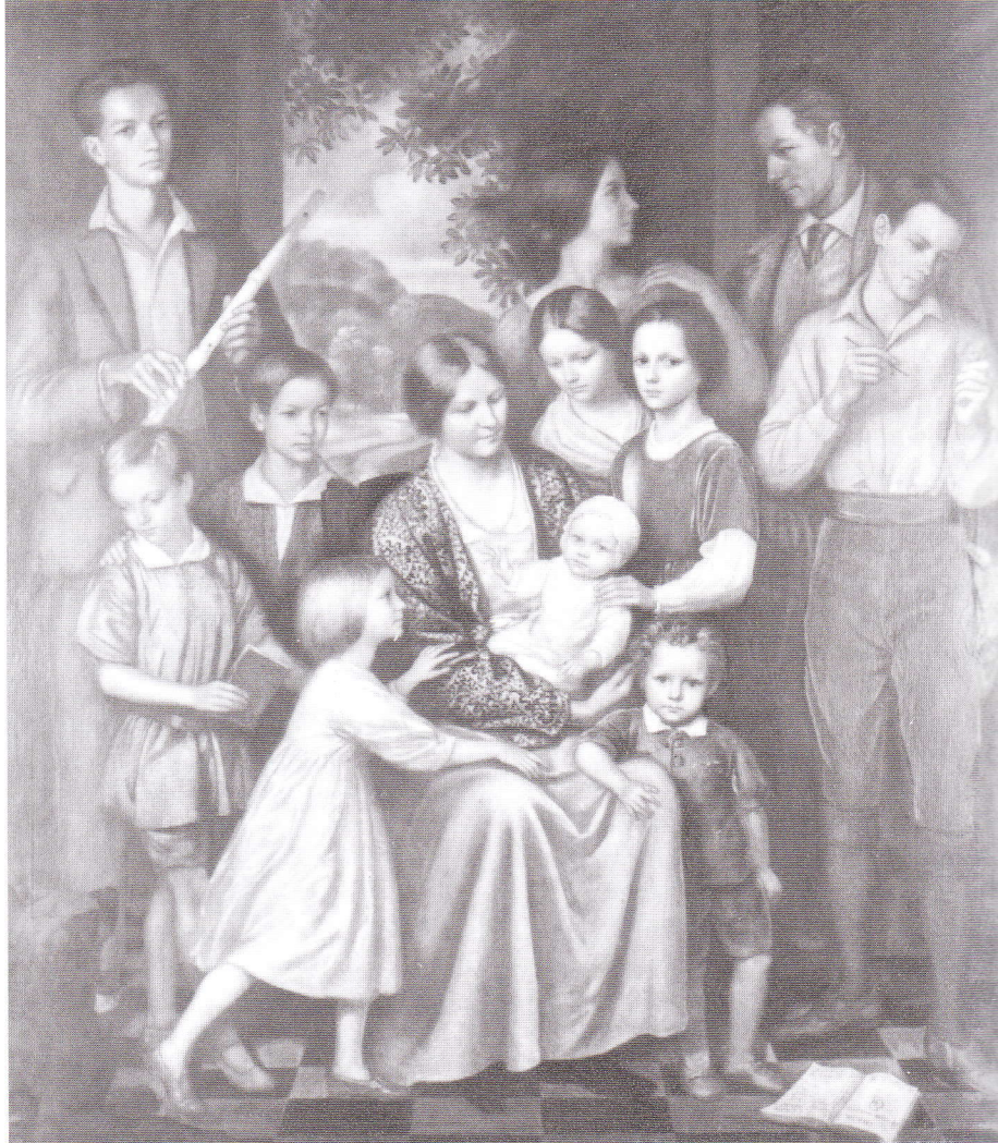
Tableau de Charles Geoffroy-Dechaume représentant sa famille, y compris l'auteur en 1925.

Désormais, la vie de Charles se partage entre l'éducation de ses enfants et