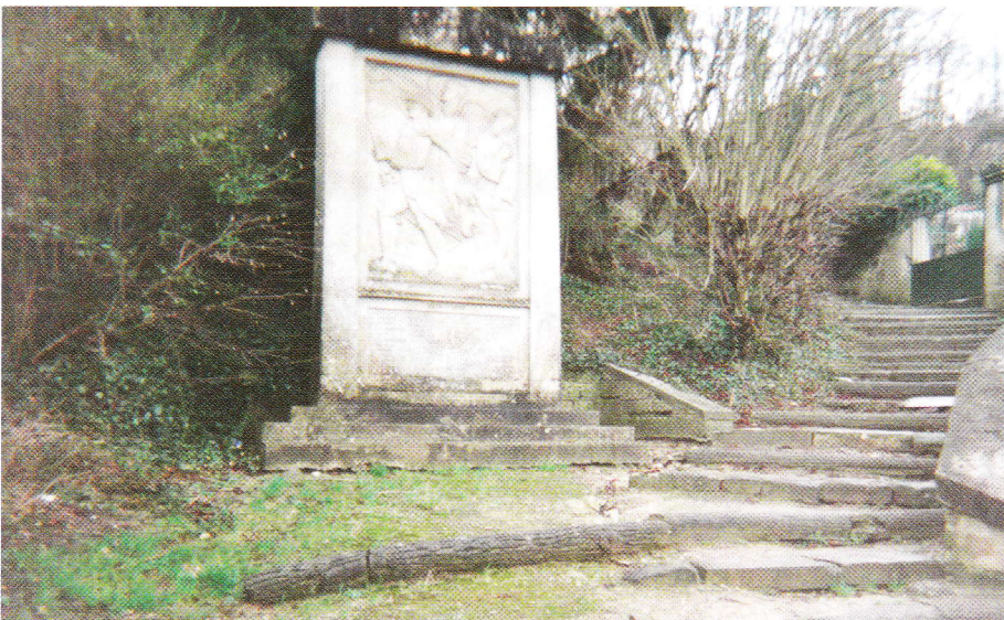
Monument aux morts commandé par la municipalité de Valmondois et sculpté par Charles Geoffroy-Dechaume en 1926. ▼