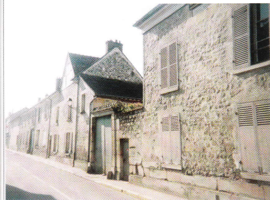
Façade de la demeure de la famille Geoffroy-Dechaume.

finira par s'accommoder de son pilon et il reprendra même certaines activités sportives comme la natation et les plongeurs dans l'Oise depuis un pont; il conduira une voiture automobile.